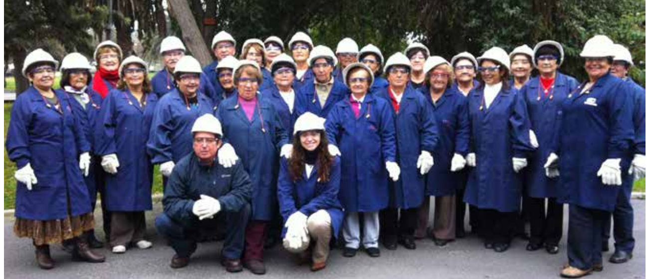
Visitas de la comunidad a la planta

En 2013, se realizaron 3 encuentros con líderes de diferentes organizaciones de Llay-Llay, instancias de retroalimentación en que se recogen las principales necesidades e inquietudes de los vecinos de la comuna.