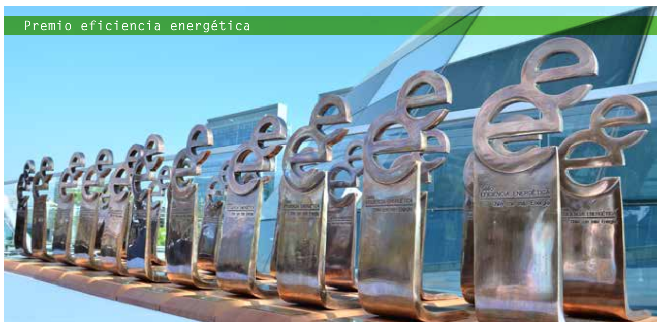
Premio eficiencia energética