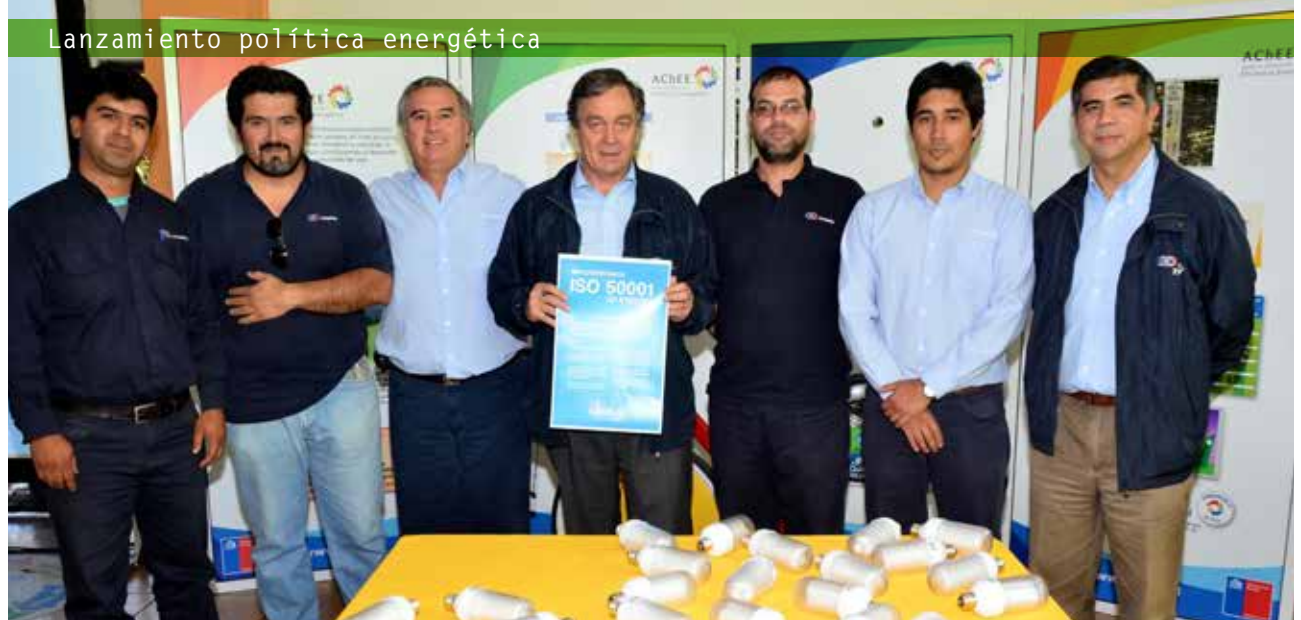
Lanzamiento política energética