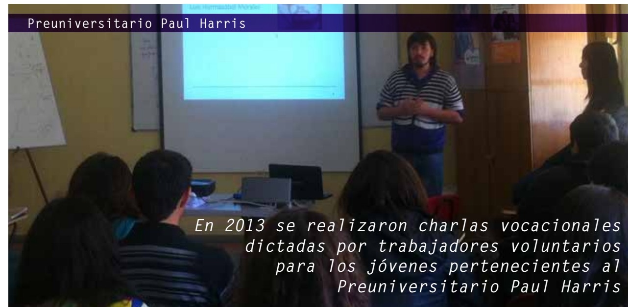
Preuniversitario Paul Harris

En 2013 se realizaron charlas vocacionales dictadas por trabajadores voluntarios para los jóvenes pertenecientes al Preuniversitario Paul Harris