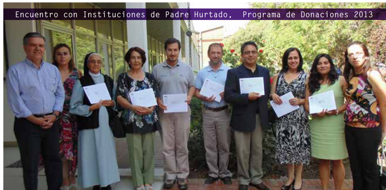
Encuentro con Instituciones de Padre Hurtado, Programa de Donaciones 2013

enfocadas en temáticas de alto impacto social. El Programa de donaciones de Cristalchile se desarrolla desde el año 2005 en la comuna de Padre Hurtado, mientras que en la comuna de Llay-Llay se implementa desde 2007, año en que la segunda planta inicia sus operaciones.