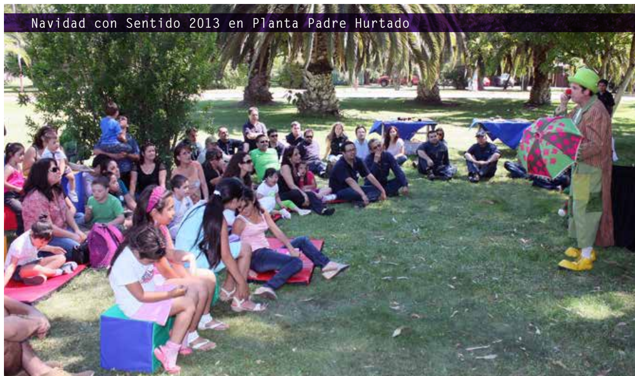
Navidad con Sentido 2013 en Planta Padre Hurtado