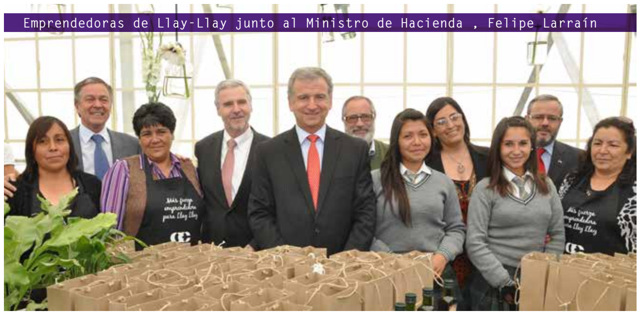
Curso de emprendimiento “Elaboración de Pastas y Conservas” en Llay-Llay