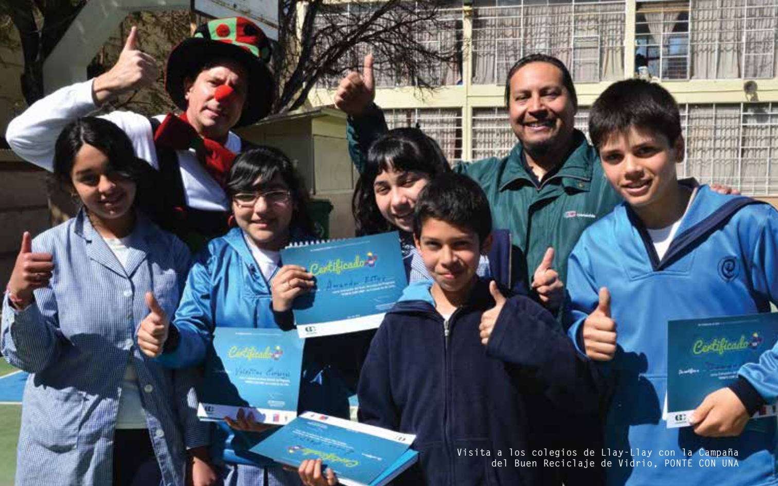
Visita a los colegios de Llay-Llay con la Campaña del Buen Reciclaje de Vidrio, PONTE CON UNA