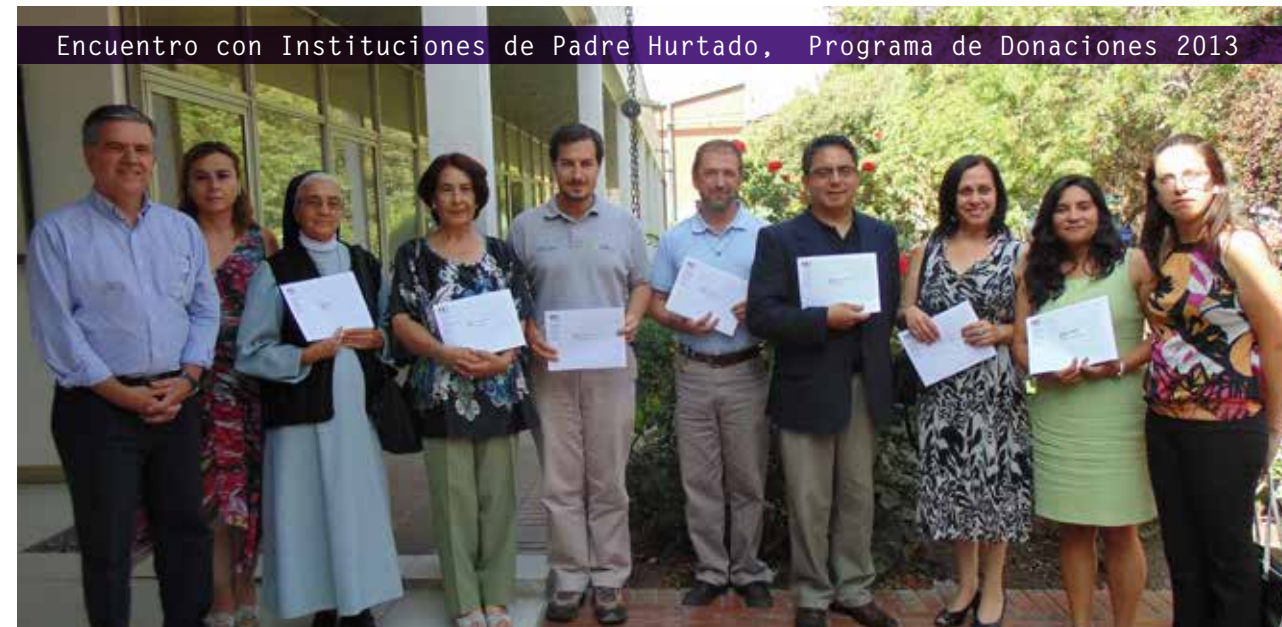
Encuentro con Instituciones de Padre Hurtado, Programa de Donaciones 2013

enfocadas en temáticas de alto impacto social. El Programa de donaciones de Cristalchile se desarrolla desde el año 2005 en la comuna de Padre Hurtado, mientras que en la comuna de Llay-Llay se implementa desde 2007, año en que la segunda planta inicia sus operaciones.