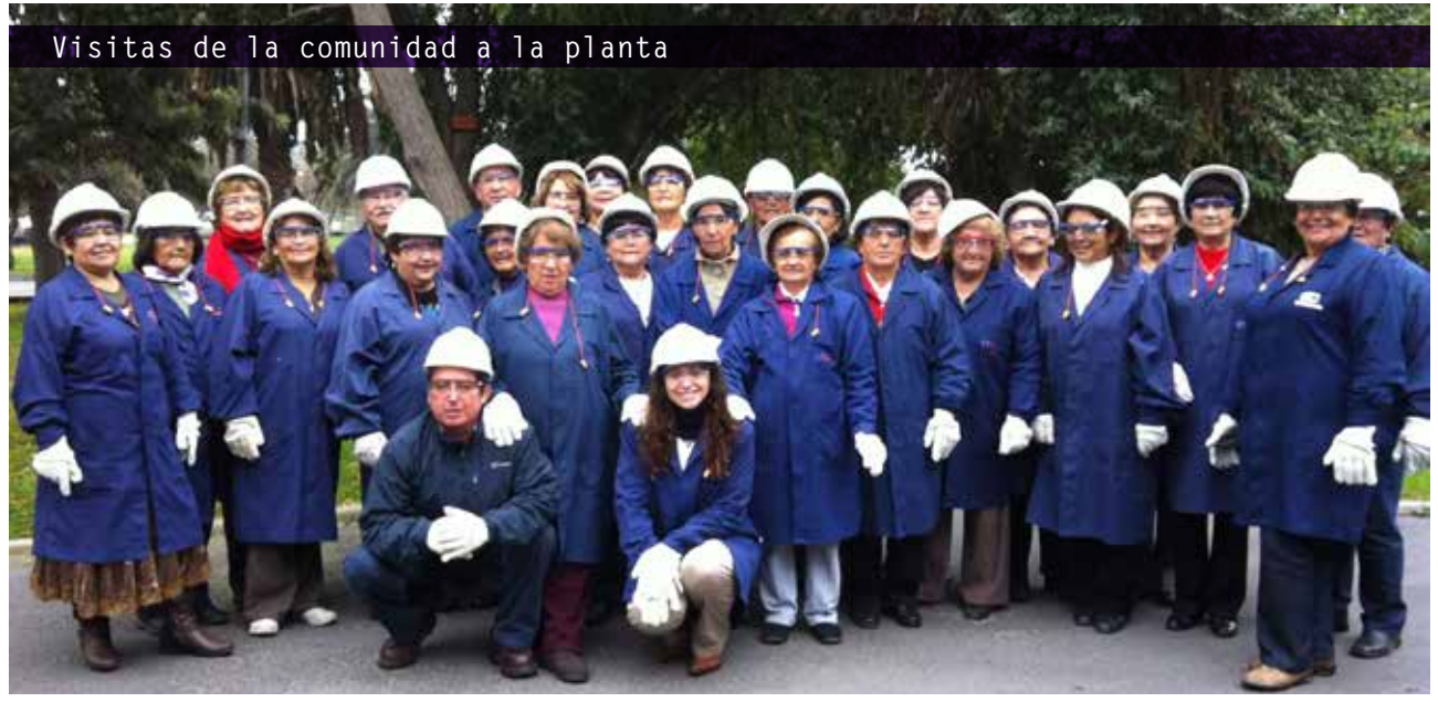
Visitas de la comunidad a la planta

En 2013, se realizaron 3 encuentros con líderes de diferentes organizaciones de Llay-Llay, instancias de retroalimentación en que se recogen las principales necesidades e inquietudes de los vecinos de la comuna.