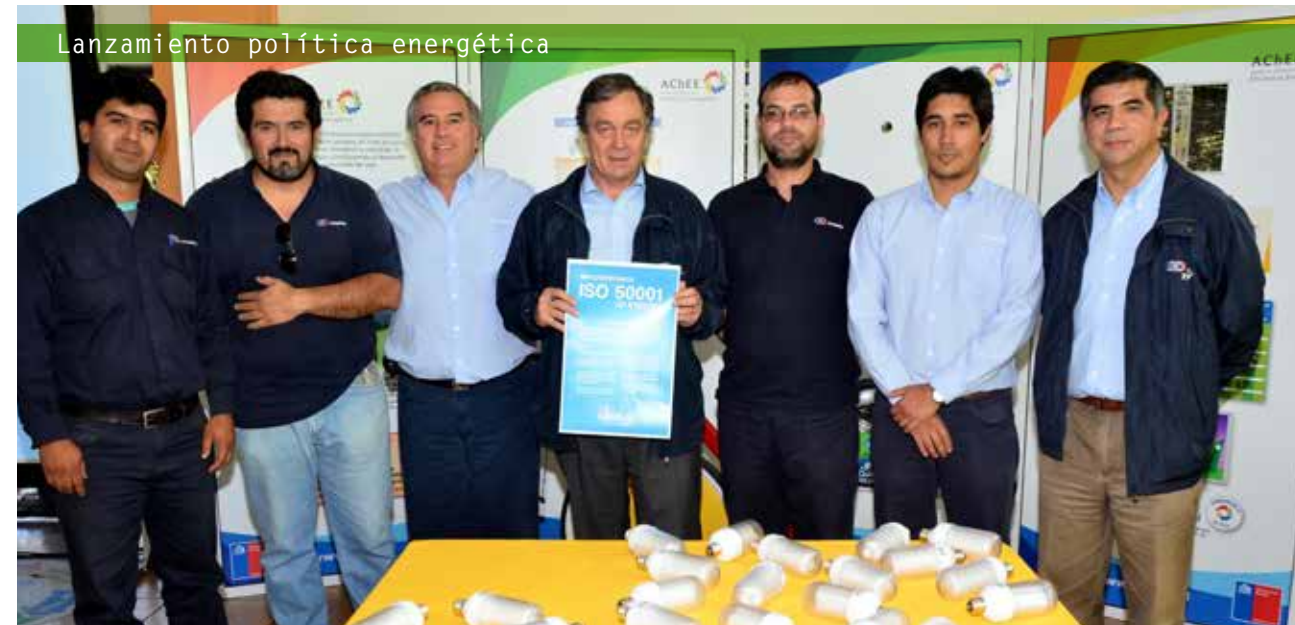
Lanzamiento política energética