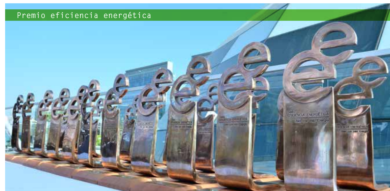
Premio eficiencia energética